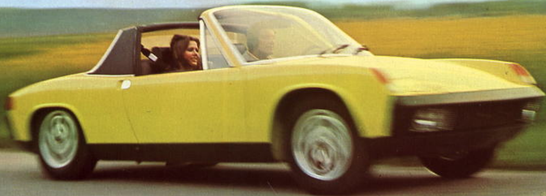
Der VW-Porsche 914